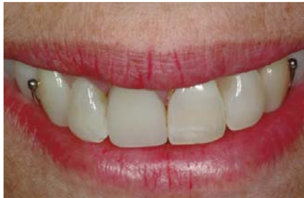
Sobredentaduras parciales removibles