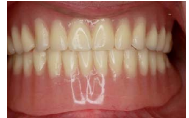
Prótesis totales o dentaduras completas